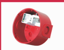
MBR Κοινή βάση για 110/230 Vac και στεγανή (IP65)