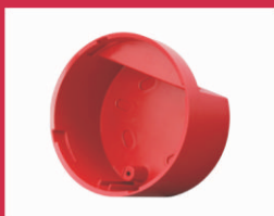
RDB Βάση στεγανοποίησης IP65