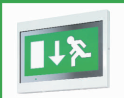
BSM + BS/W/AD