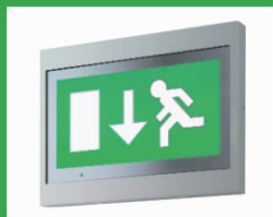
BSM + BS/C/AD