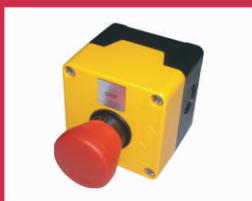
ES100 Μπουτόν ακύρωσης κατάσβεσης