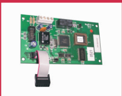
NC Πλακέτα διασύνδεσης των πινάκων DF6100, DF61002 και DF6000.