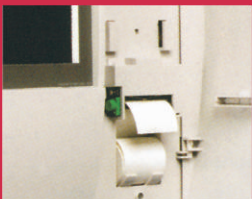
DFPR Θερμικός εκτυπωτής για την σειρά πινάκων DF6000.